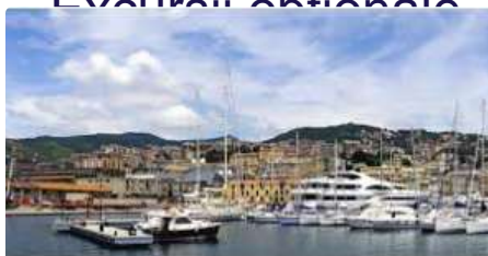
Excursii Optionale Genova