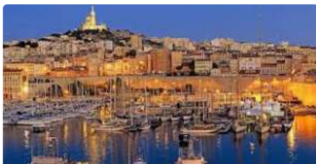
Excursii Optionale Marsilia