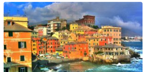
Excursii Optionale Genova